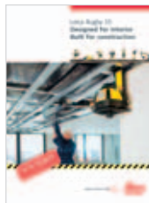
Leica Rugby 55 El láser de construcción polivalente

R50 (Art. No.:753672): Láser de clase 1 según IEC 60825-1 y EN 60825-1