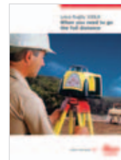
Leica Rugby 100LR El láser de construcción de gran alcance