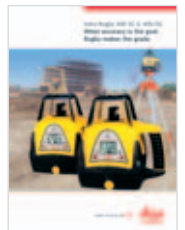
Rugby 300SG/400DG Láseres de construcción de inclinación simple e inclinación doble