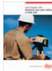
Leica Rugby 100 El láser de construcción robusto